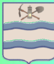
Stemma del Comune di Rimella